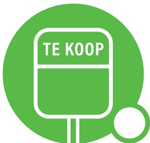
Te koop bord